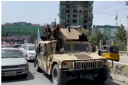
Convoi taliban en 2021

L'OTAN est parti en guerre en Afghanistan pour déstabiliser la Chine. Les ONG créées là-bas s'accaparent l'argent prévu pour le peuple Afghan. Pourtant les talibans, une ethnie unie avec le peuple Afghan par la même religion, auront toujours lutté contre la drogue, l'OTAN installe la culture du pavot dans le pays.